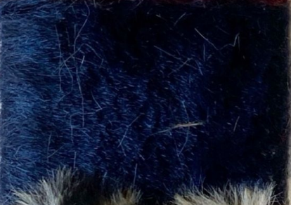
ZARINA 1 13