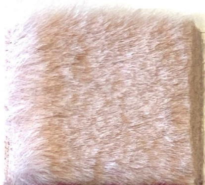
ZARINA 1 11