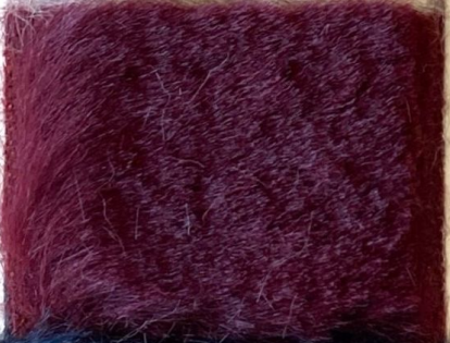
ZARINA 1 12