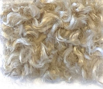
ZARINA 12 1