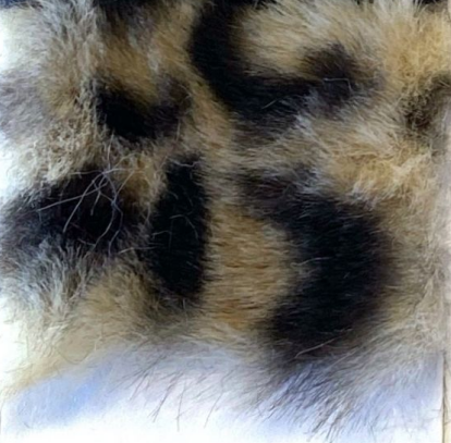
ZARINA 2 21