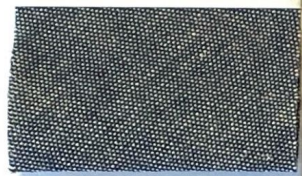
DENIM 12 204