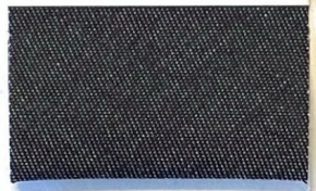
DENIM 1 201*