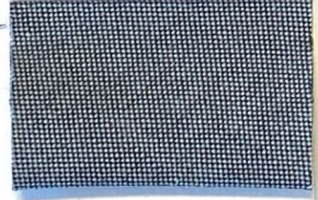
DENIM 2 206*