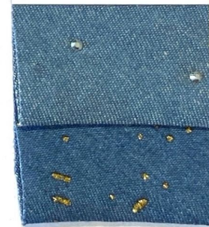
DENIM SHINE 1